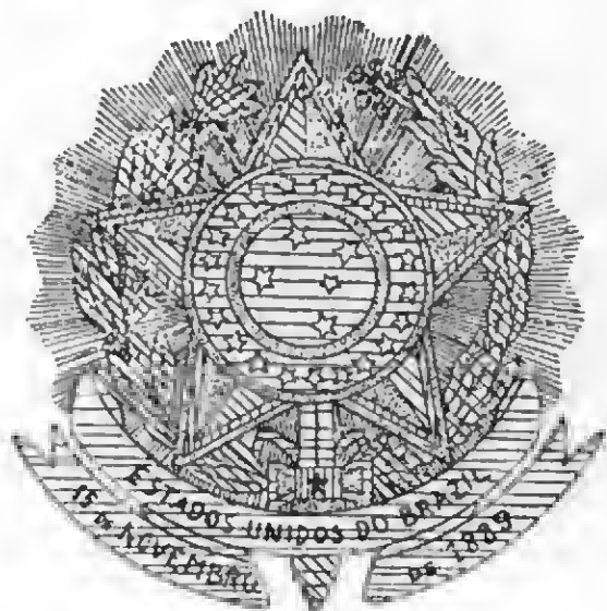
Estrela flamejante e gládio maçônico, impostos disfarçadamente à república brasileira.

O estudo que acabamos de fazer demonstra à sociedade que a marca da República não nasceu do acaso, nem do mau gosto proverbial dos positivistas, ou ainda da pouca inteligência de um gravador estrangeiro. Foi propositalmente escolhida e tem alta significação secreta maçônica.